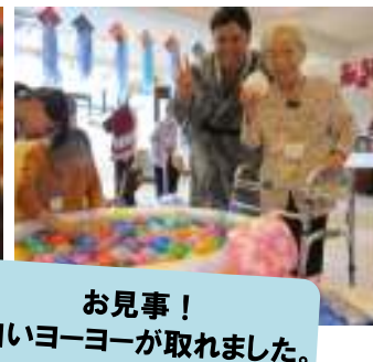
お見事！ 白いヨーヨーが取れました。