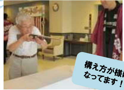
構え方が様 になってます！