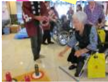
投げ方にコツがある ようです。

今回は、お祭りの雰囲気味わっていただき たいと思い、昔懐かしい屋台を再現。 皆様の思い出になるようなお祭りを開催致し ました。