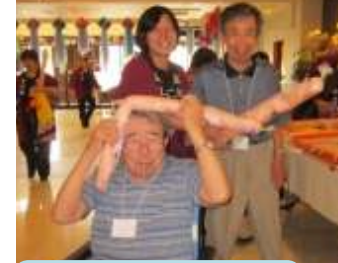
景品のさくら棒。 すごく大きいですね！