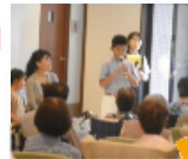
リコーダー でも、一曲 発表してく れました。

一曲終わるごとに、「上手だなあ！」「かわいいね」と、皆様 あたたかい拍手を送っていただきました。 子ども達の成長も感じられるコンサートです。また次回、 新しい曲を聴かせるのを楽しみにしています。