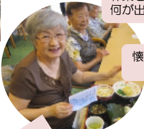
懐石のランチなんて 嬉しいね！