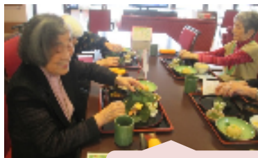
朴葉を開くと 何が出てくるのかしら・・・♪