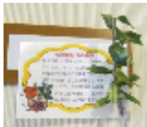
居室とデイサービスの入口に柵を飾りました。