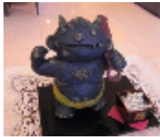
ロビーにも鬼が登場しました。