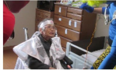
鬼とのんびりお喋りをする方も……♪