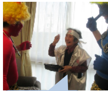
投げちゃっていいのかしら～