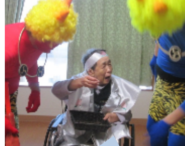
ゆっくりしていきなさい～