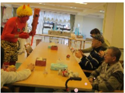
見たことのある顔のような……