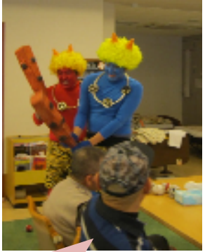
こっちへ来るなよ～

鬼をじっくり観察する方、豆の代わりに丸めた新聞紙を投げる方、鬼の正体がわかってしまった方もいらっしゃったようですね。