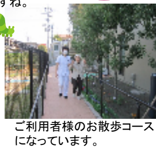
ご利用者様のお散歩コースになっています。