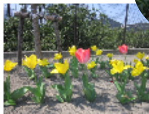
咲いた〜咲いた〜チューリップの花が♪♪♪