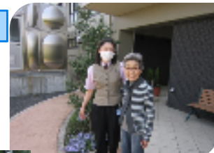
笑顔がグッドです😊