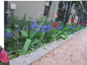
ムスカリもかわいいですね。