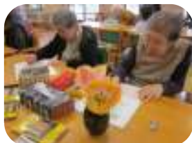
花のある空間。やっぱり良いですね♪