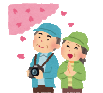
この日は一分咲き。これからが楽しみです♪