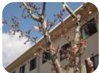
この日は「ペリデ桜開花宣言」でした。