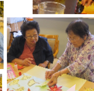
こっちの方がいいかしら