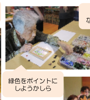
夢中になっちゃうね