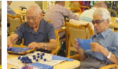
こちらは何の作品でしょうか・・・