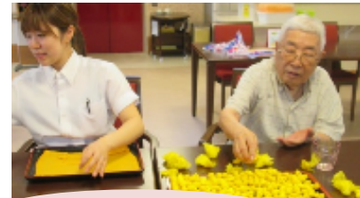
大作をお楽しみに～

11月の芸術祭に向けて、皆様作品作りに力を入れていらっしゃいます。今年の芸術祭・ペリデ美術館は、音楽がテーマです。音楽を通して、楽しかった事、励まされた事などを思い出させるような作品を制作中です。音楽や歌のイメージを形にして、視覚・聴覚ともに楽しんで頂きたいと思います。