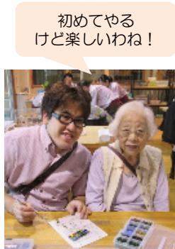
初めてやるけど楽しいわね！