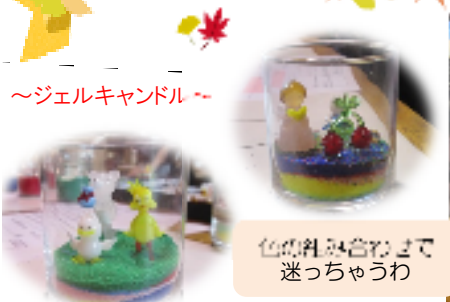
～ジェルキャンドル～

今年の特別外出ツアーは、磐田市の新造形創造館へ行ってきました。様々な作品を制作できる、体験型の文化施設です。