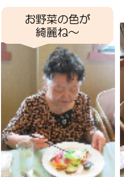
お野菜の色が綺麗ね～