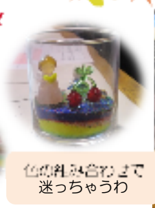
色の粒を混ぜて迷っちゃうわ