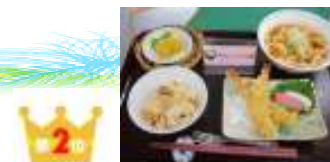
天ぷらうどん御膳