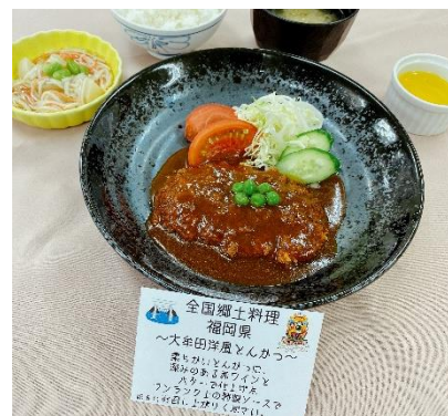
～【郷土料理】福岡県 大牟田風とんかつ～