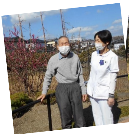
梅の花を眺めて、ほっと一息。