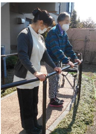
つま先・かかと上げ

歩行訓練では、ただ歩くだけではなく様々なアスレチックトレーニングを取り入れています。