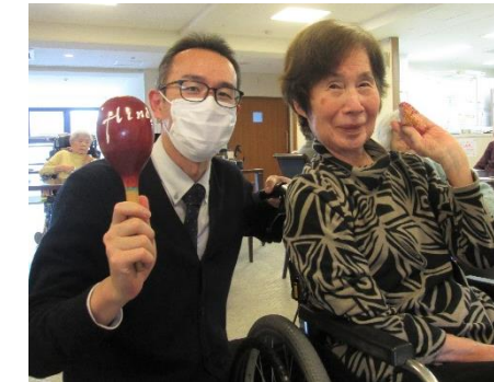
「頑張って投げるわよ♪」 「応援してます！」