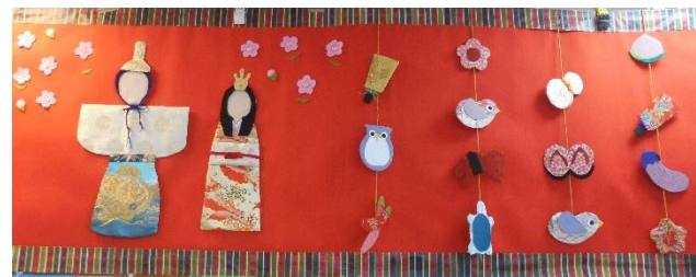
～デイサービス3月壁画～