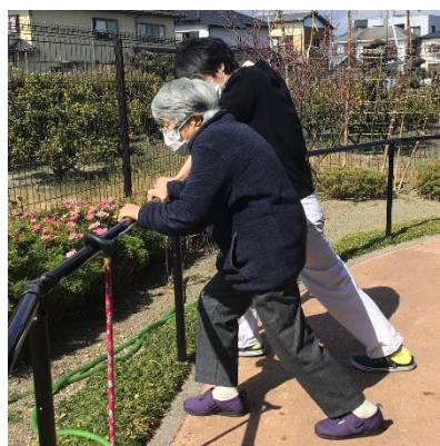
アキレス腱伸ばし

歩行訓練では、ただ歩くだけではなく様々なアスレチックトレーニングを取り入れています。