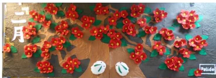
～椿と雪兎～ 2月の壁画

全国のデイサービスご利用者様による作品などが掲載される雑誌、【月刊デイ】。ペリデご利用者様の作品も、全国の方には是非見ていただきたい！と、2月の壁画を出展、応募することにしました。優秀作品に選ばされると、紙面で発表されるそうです。