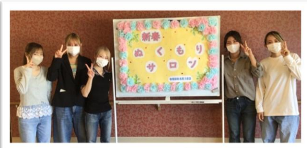
「静岡県美容専門学校」の学生の皆様。 心のこもった施術をしてくださいました。