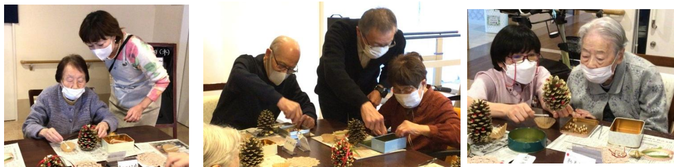
講師の方によるレクチャーのもと、スタッフと一緒に楽しく作業を進めました。

ショートステイのアートプログラムとして、【松ぼっくりアート】を行いました。この時期にぴったりの作品で、クリスマス飾りとしてはもちろん、お正月にも飾っていただけるようになっています。