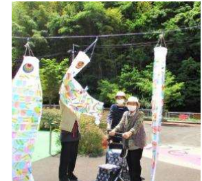
「歩くデイ！」の皆様も足を止めてご覧になっていました。