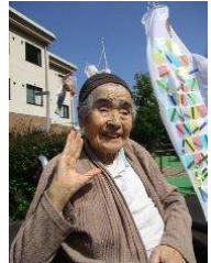
泳ぐ姿を見るのは、 気持ちがいいよ！