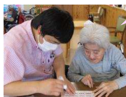
どの辺に 貼ろうかしら・・・