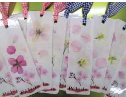
ガーデンと、 プログラム【お花見散歩】で集めた桜を使っています。