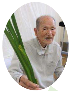
菖蒲湯は、久しぶり！ 楽しみだよ♪