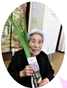
今日は、 ゆっくり湯船につかるわ♪

菖蒲は、強い香りで邪気を祓うと言われています。 菖蒲湯には、疲労回復・ リラックス効果・血行促進 などの効果があります。