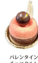
バレンタイン チョコタルト